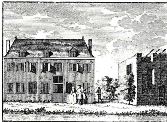
Het oude huis Duckenburg.

dezen veldtocht in het gevolg van Karel bijwoonde, heeft in zijn Mémoires dag aan dag de bewegingen van zijn