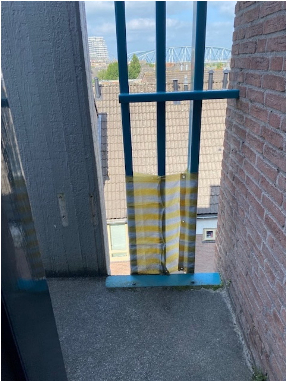
Verstuurd vanaf mijn iPhone