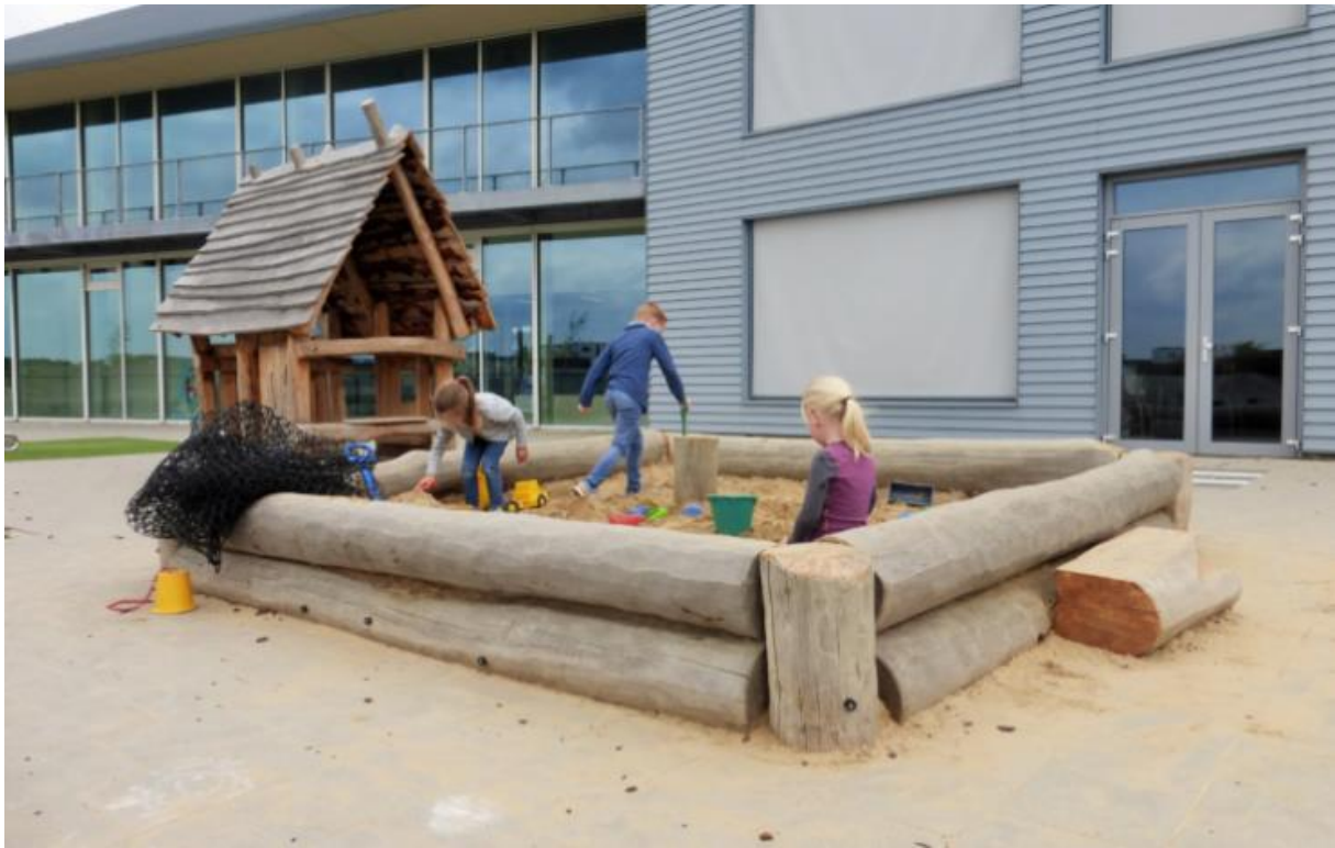
Zandbak, speelhuisje, buitenkeuken etc. bovenop de tegels