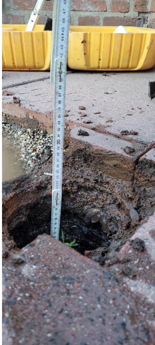
Figuur 4 vermoedelijke opbouwhoogte vanaf (beton)dek tot bovenzijde tegel is ca. 30 cm.