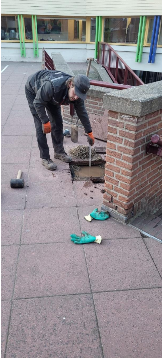
Figuur 3 het hemelwater stroomt door de split laag richting het laagste deel van het dak en blijft daar staan. Overtollig water zal over moeten stromen.