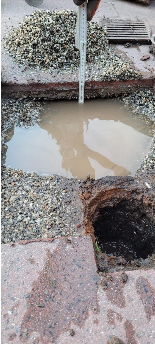
Figuur 5 opbouwhoogte vanaf dakbedekking tot bovenzijde tegel is ca. 10 cm. Dit is gemeten op het laagste punt van het schoolplein.