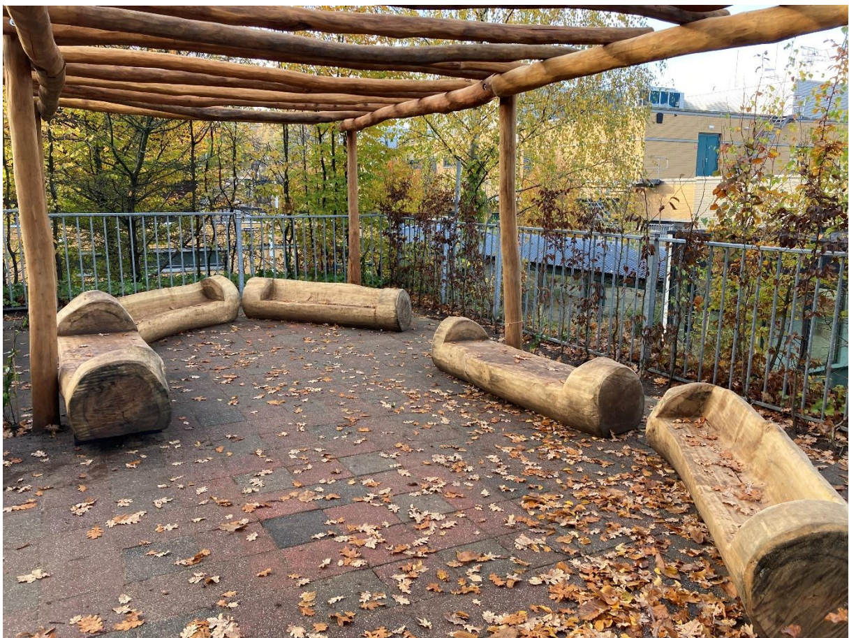
Buitenslokaal met robuuste zitbanken