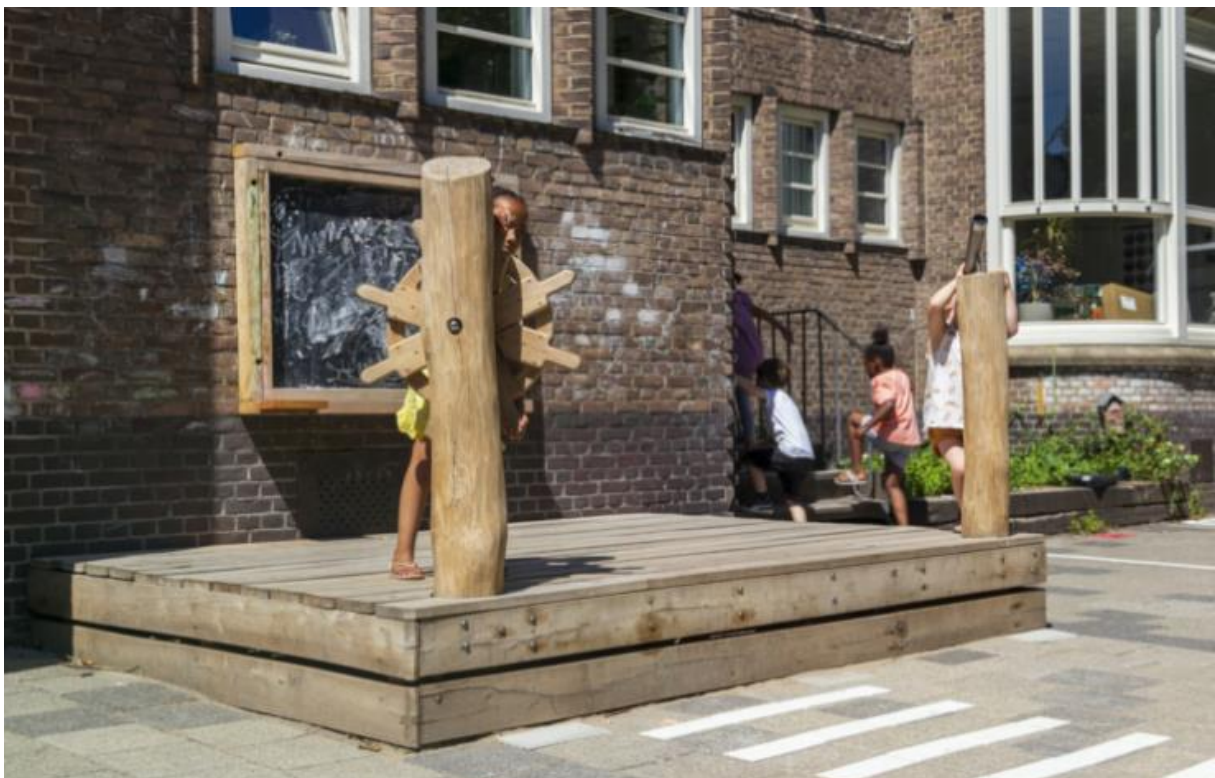
Vlonders tbv spelen, zitten etc.