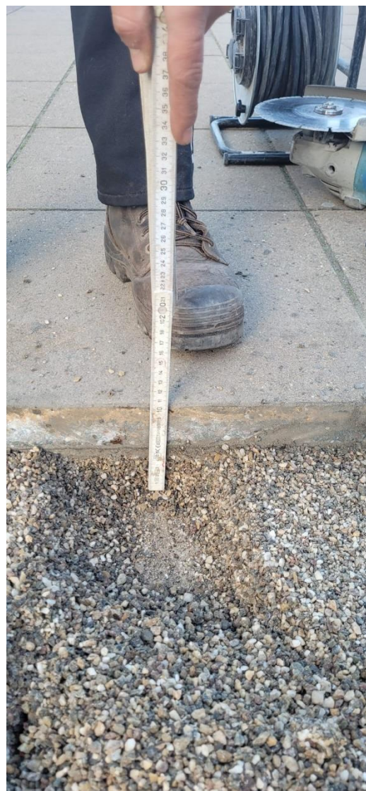
Figuur 2 opbouwhoogte vanaf dakbedekking tot bovenzijde tegel is ca. 10 cm. Dit is gemeten op het hoogste punt van het schoolplein.