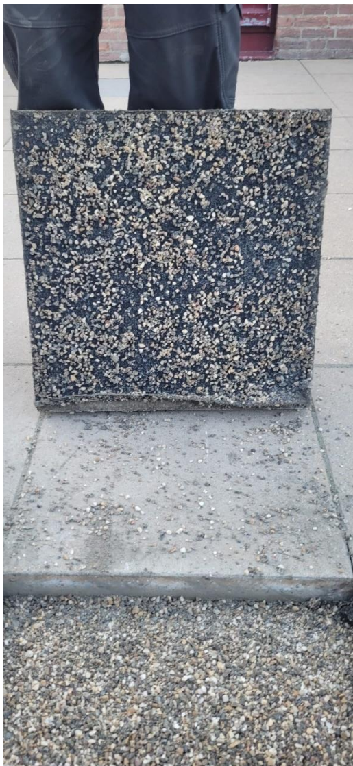
Figuur 1 betontegel 50x50x5 cm met hieraan het 'onbekende' doek. Doek zit los, maar door vorst verkleefd aan de tegel.

Wij zien alleen kansen om óp de huidige tegelafwerking een inrichting te verzorgen. Dit zal ons beperken in de mogelijkheden, maar kansen zijn er zeker. Denk hierbij aan plantenbakken op tegels, buitenleslokaal met inrichtingselementen op de tegels etc. Aan het einde van dit verslag zijn enkele voorbeelden toegevoegd. Het betreft voorbeelden en dit dient nader afgestemd en uitgewerkt te worden.