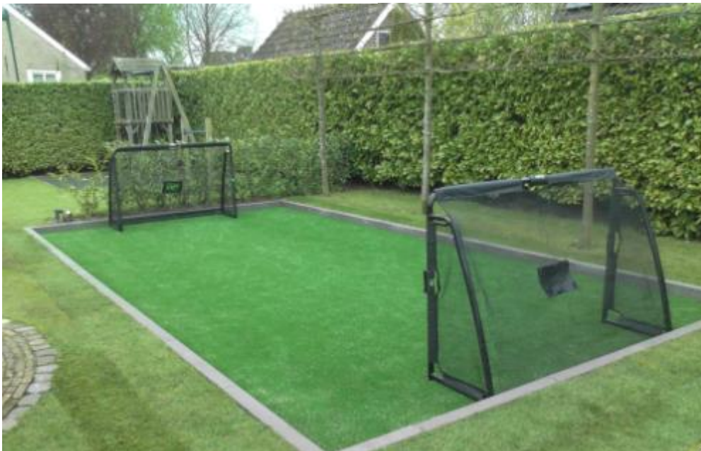
Voetbalveldje van kunstgras