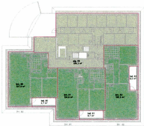
begane grond - bruto vloeroppervlakte