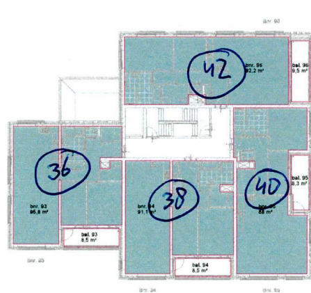
eerste verdieping - gebruiksoppervlakte