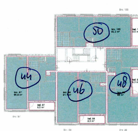
tweede verdieping - gebruiksoppervlakte