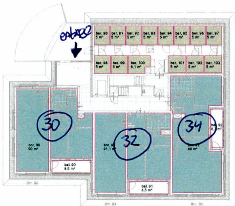
begane grond - gebruiksoppervlakte