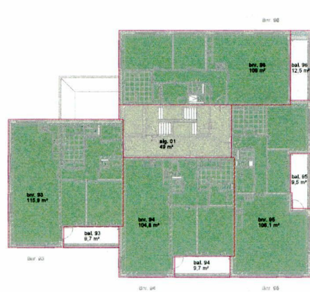
eerste verdieping - bruto vloeroppervlakte