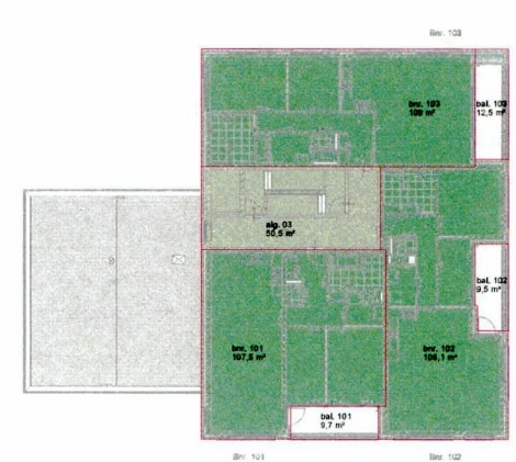
derde verdieping - bruto vloeroppervlakte