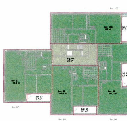
tweede verdieping - bruto vloeroppervlakte