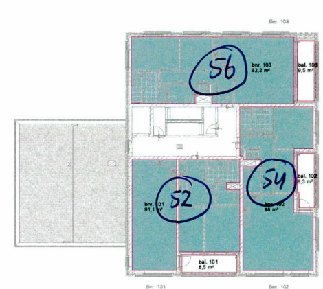
derde verdieping - gebruiksoppervlakte