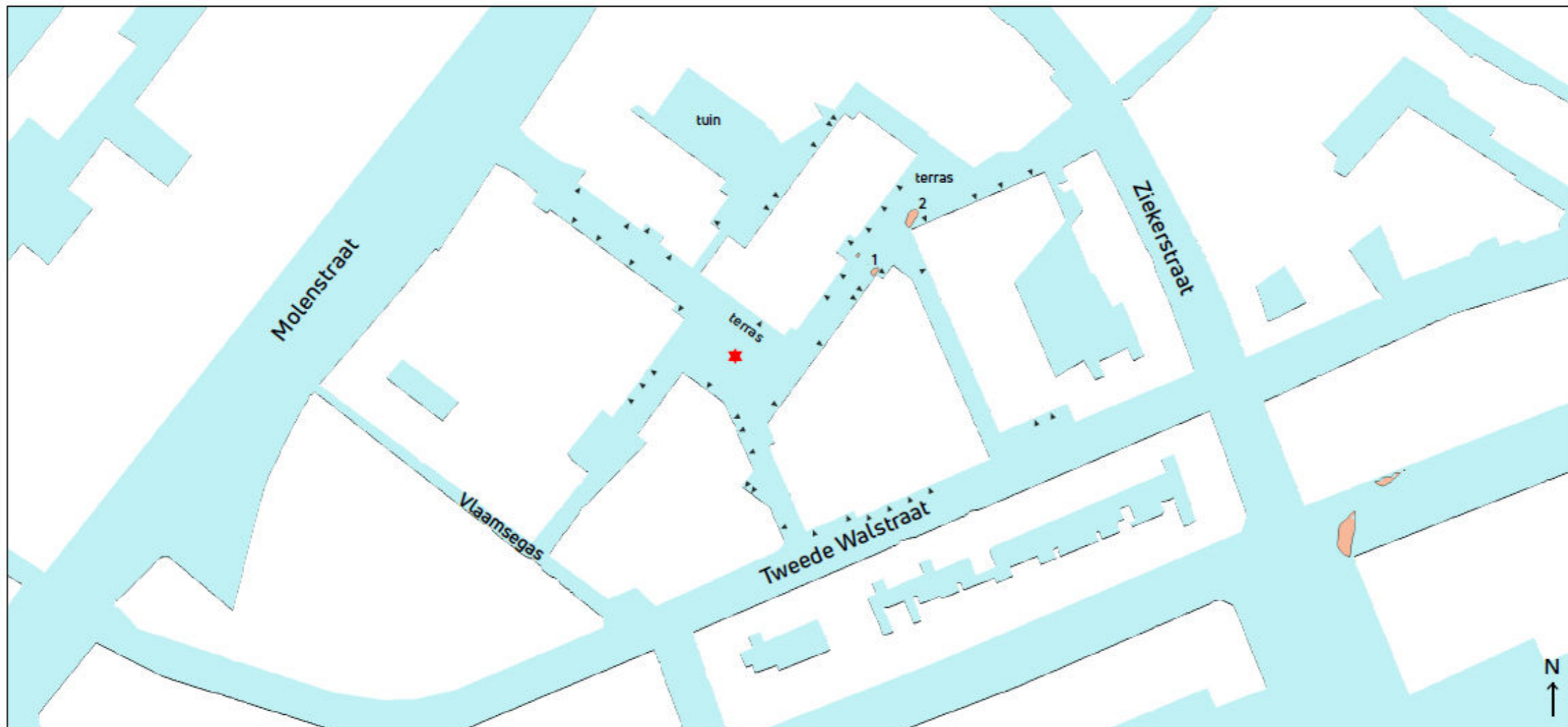
Figuur 4.1: Risico-inventarisatie maaiveldniveau.

Het centrale plein is aangeduid met de rode ster.